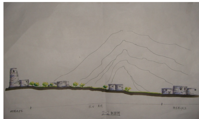
过渡带东西剖面图