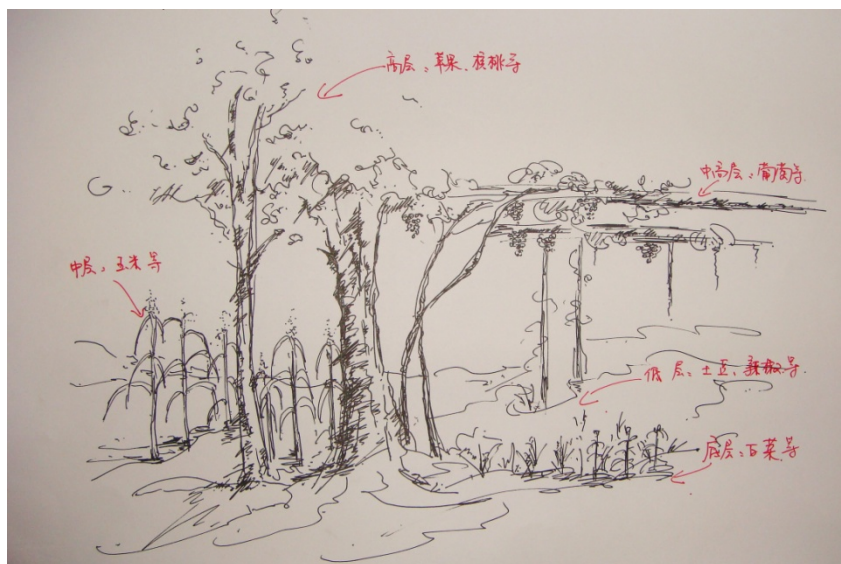
农田果园 种植原型