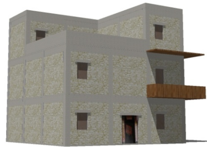
新区建筑单体原型