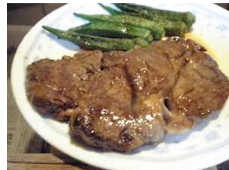
びふてき(ビフテキ)