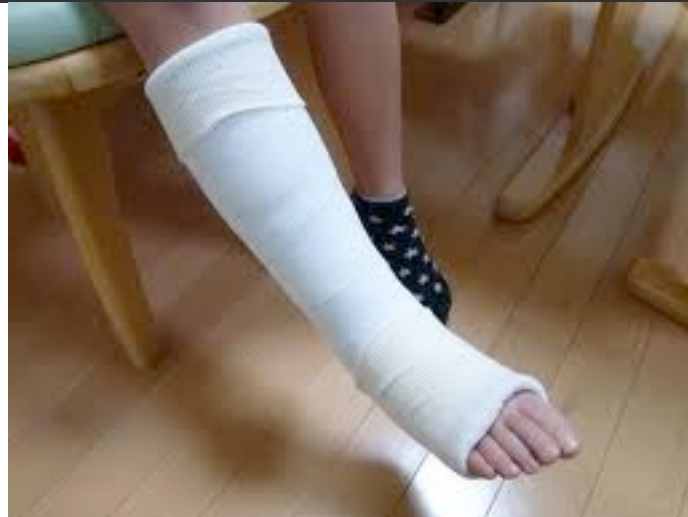
あしのほねをおる