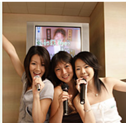
カラオケで友だちとうたをうたう