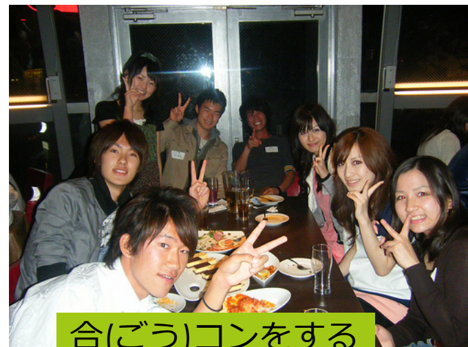
合(ごう)コンをする