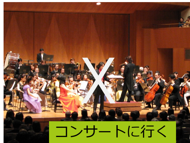
コンサートに行く