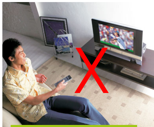
家でテレビを見る