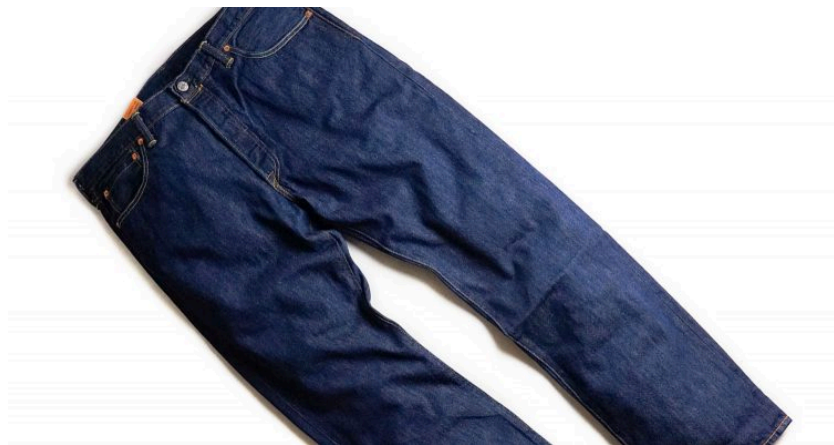
ジーンズ（じいんず）