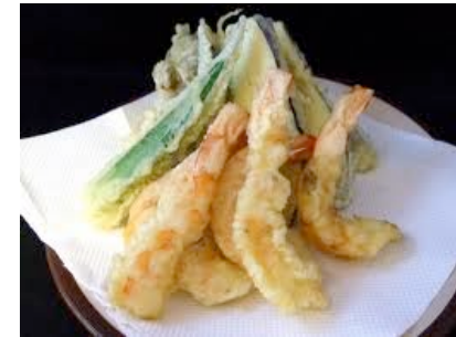
メニュー (めにゅう)