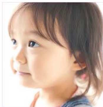
10 years ago