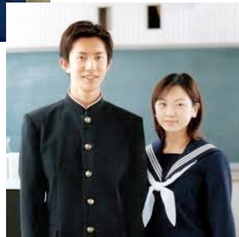
at high school