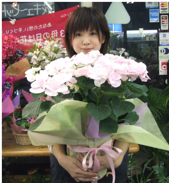
プレゼントを買う