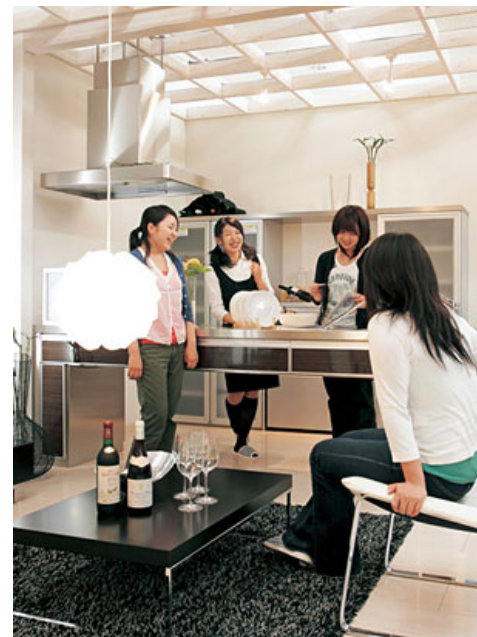
パーティーに行く