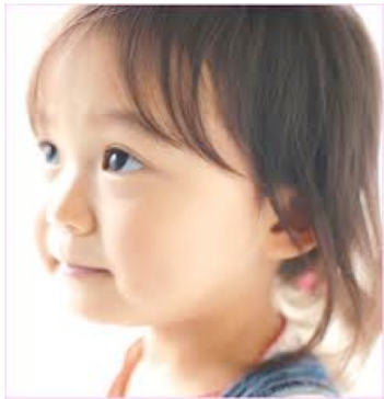
10 years ago