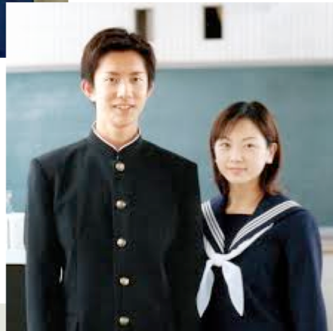
at high school