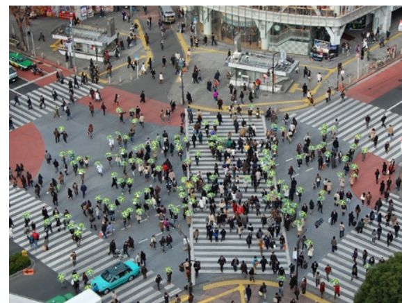
こうさてん おうだんほうどう