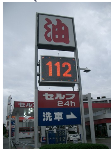
ガソリンスタンド