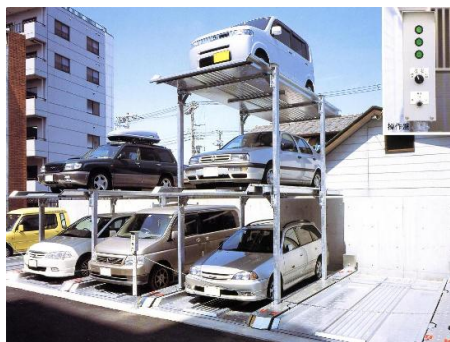
ちゅうしゃじょう